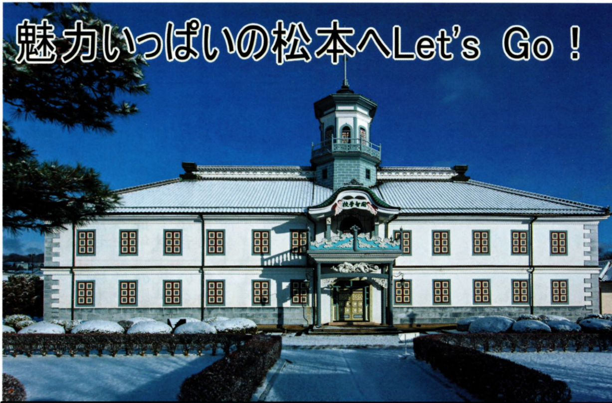
雪におおわれた旧開智学校